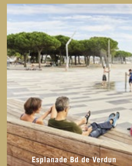
Esplanade Bd de Verdun