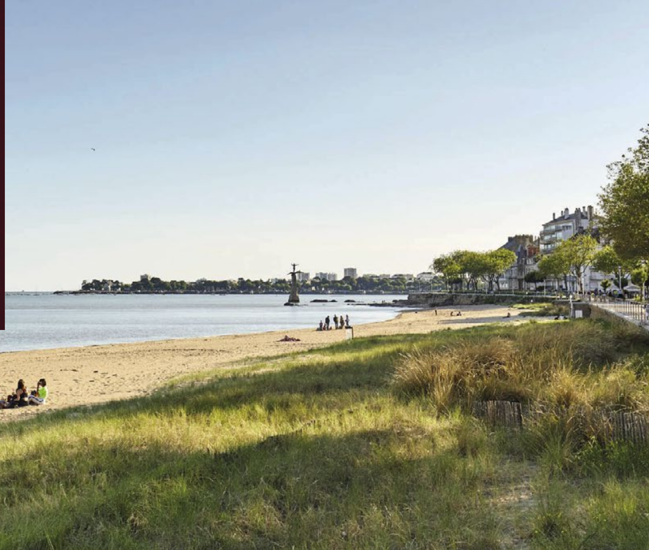
La Grande Plage au pied de la Place du Commando

Aujourd'hui, devenue une destination en vogue grâce à son littoral préservé, son port, son centre-ville commerçant et ses différents événements culturels et touristiques, Saint-Nazaire saura sublimer votre quotidien.