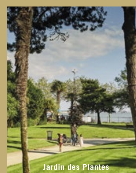
Jardin des Plantes