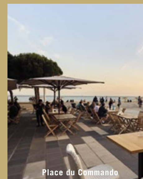
Place du Commando